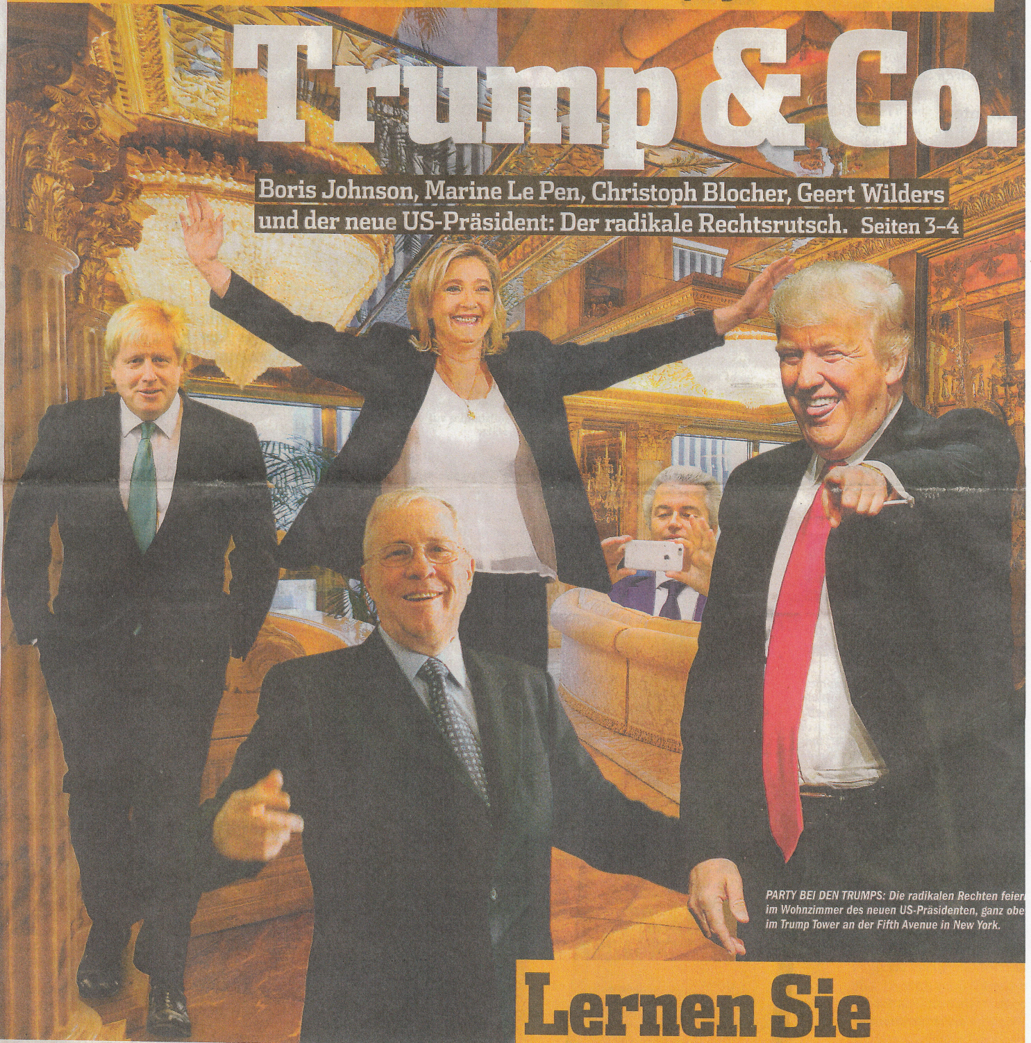
PARTY BEI DEN TRUMPS: Die radikalen Rechten feiern im Wohnzimmer des neuen US-Präsidenten, ganz oben im Trump Tower an der Fifth Avenue in New York.

Boris Johnson, Marine Le Pen, Christoph Blocher, Geert Wilders und der neue US-Präsident: Der radikale Rechtsrutsch. Seiten 3-4