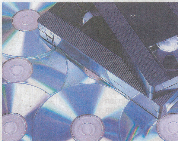
SCHÖN ALT: Die auf Videokassetten gespeicherten Erinnerungen kann man ins digital retten – dazu braucht es in erster Linie das richtige Kabel und ein Abspielgerät.

Dieser Text stammt aus der Zeitschrift für Konsumentenschutz «Saldo».