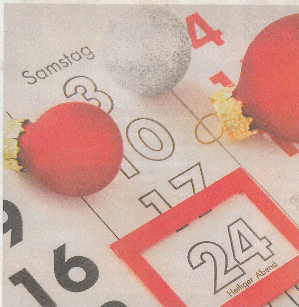
BLÖDES 2016: Früher war nicht nur mehr Lametta, sondern auch mehr frei an den Festtagen. Immerhin – nächstes Jahr ist's wieder ein bisschen besser.

REGAY: Nein. Im Gesetz steht, dass eine Kündigung das Recht, sich auch während der Bewerbung zu nehmen für die Bewerbung. Dazu gehören Telefonate oder Termine für Gespräche. Hingegen müssen administrative Teil der Bewerbung, wie das Studium der Unterlagen oder das Zusammenstellen der Bewerbungsunterlagen, weiterhin auf Sie verfallen. Das Gesetz sagt, wie viel Zeit Ihre Chefin Ihnen zur Verfügung stellen muss. Am besten rechnen Sie das direkt mit dem Arbeitgeber. Informieren Sie sie, wie viel Zeit Ihre Chefin Ihnen zur Verfügung stellen muss. Am besten rechnen Sie das direkt mit dem Arbeitgeber. Informieren Sie sie, wie viel Zeit Ihre Chefin Ihnen zur Verfügung stellen muss.